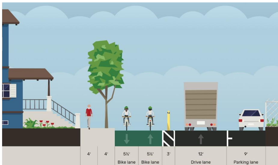
Figura 2 Estado propuesto: sección transversal típica de 8 th Street NE